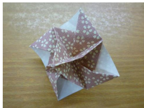
前回の作品（立体風車）

対象 身体障害のある方（府中市在住） 会場 府中市立心身障害者福祉センター内 参加費 無料 定員 8名 ※申込み多数の場合抽選 内容 季節の折り紙など